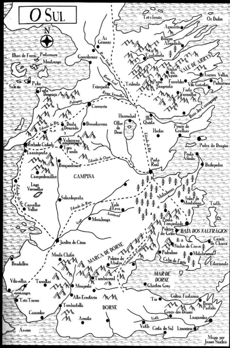
Mapa por James Sinclair